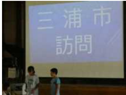
三浦市訪問の発表