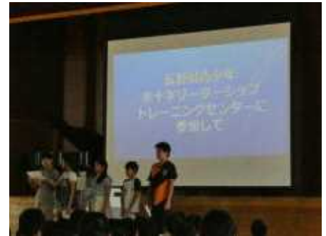
リーダーシップトレーニングセンターの発表