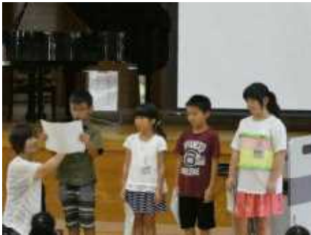
2学期のめあての発表