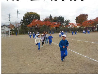
10/31～11/14体力作り旬間 マラソンに励む子どもたち