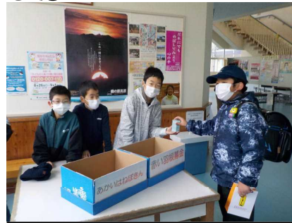
11/22～25 赤い羽根共同募金 たくさんの募金が集まりました