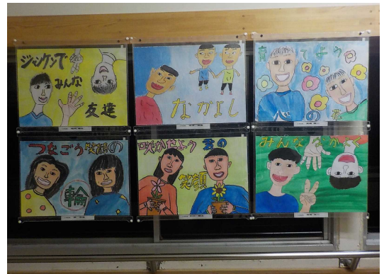
なかよしポスター「みんなの笑顔」