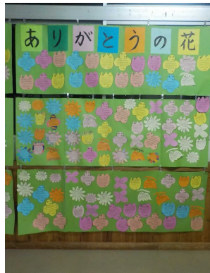
ありがとうの花がいっぱい！