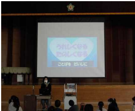
校長講話 「言葉が大事に」

今月は、人権教育月間（なかよし月間）でした。学校では、人権に関する校長講話、ポスターや標語の校内掲示、児童会生活交流委員会による「ありがとうの花」の活動、学級満足度テスト、各学年での人権学習等を行い、人権感覚を高める取組を行いました。日頃から人権を大切に考えた教育活動を行ってきていますが、この一ヶ月は、自分の言動を見直す良い機会となりました。差別に気づき、差別をなくそうとする力をつけること、自分のよさ、友だちのよさに気づき、いじめをなくしたり、友達関係を改善したりしようとする態度を身につけること等、この月間で学んだことや感じ取ったことを日常に生かしてほしいと思います。